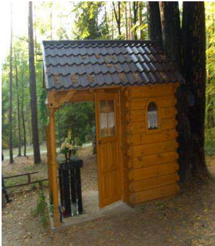
Krzyż stojący w lesie koło „Pięciu sosen” z roku 1937 gdzie kiedyś stała żydowska karczma, gdzie w Wielki Piątek odbywały się huczne zabawy, karczma ta zawałiła się i wówczas postawiono tenże krzyż.