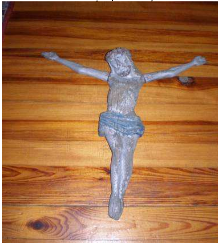
Spalona kapliczka św. Teresy.

Ona opiekowała się jego majątkiem. Stała tam przy drodze między Małym a Dużym Budomierzem. W czasie komuny została przewrócona i leżała 1 rok na ziemi. W późniejszym czasie przeniesiono ją do kapliczki w Krowicy Samej koło kościoła, którą nazwano od tego czasu kaplicą św. Teresy.